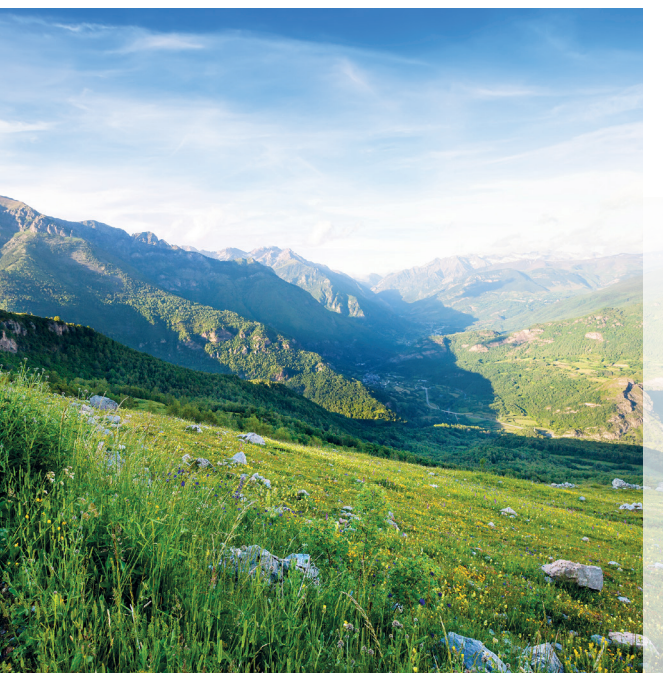
Wir wünschen Ihnen schöne, erholsame Sommerferien.