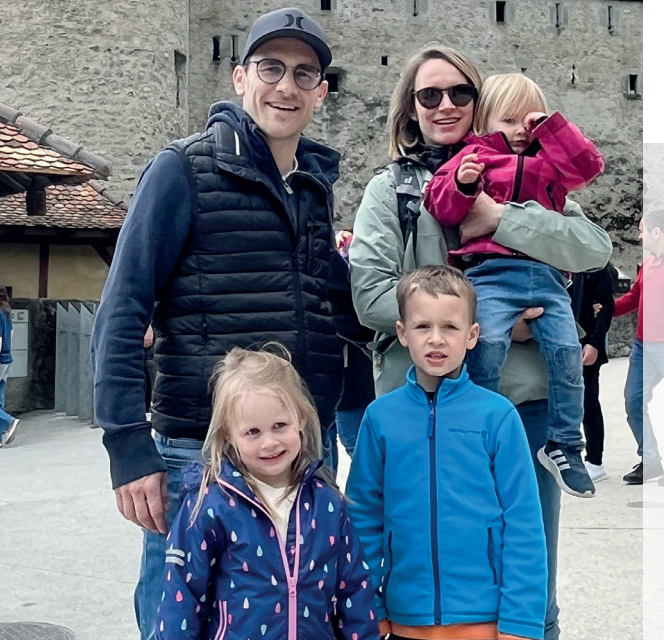
Wir freuen uns auf die Begegnung, resp. die Zusammenarbeit mit dir.

Ich wünschte mir mehr Arbeit mit Menschen und weniger mit inhaltlichen Themen. Sicher auch eine grosse Portion Neugier und der Wunsch nach Sinnhaftigkeit, meine Lebenszeit für Grösseres als Profitabilität und Volumen einzusetzen. Nicht zuletzt aber auch eine leise Stimme, die sagt(e): Wage es.