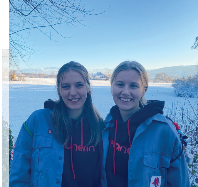
Die neuen Cevi-Stufenleiterinnen.

werden nach den Sommerferien über die Kirchen-APP und die Webseite weitere Details bekanntgeben. Infos findet ihr auch auf www.gossau-zh.ch .